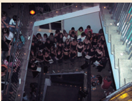
Treppenhauskonzert im Schulhaus

Teilnahme an Wettbewerben: Die Teilnahme an Wettbewerben wie „ Känguru-Test “ (Mathematik), „ First Lego League “ (Robotik), „ Alte Sprachen “ (Latein), „ Jugend trainiert für Olympia “ (Sport) ist für uns selbstverständlich und war in der Vergangenheit immer wieder vom Erfolg gekrönt.